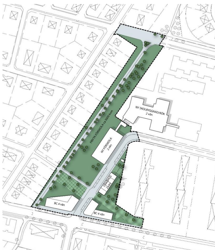
Illustration som visar hur området skulle kunna byggas ut.

Upplysningar lämnas på Samhällsbyggnadsförvaltningen av planarkitekt Oskar Anselmsson tel: 0410-73 32 86, e-post: oskar.anselmsson@trelleborg.se