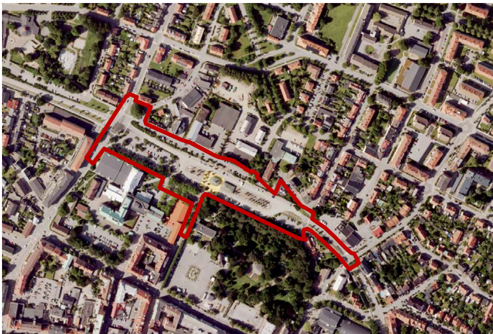
Planområdet med omgivning

Planhandlingarna består av planbeskrivning, plankarta, illustration och planprogram.