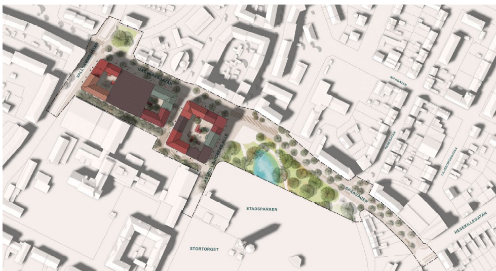
Illustration som visar hur området skulle kunna byggas ut.

Upplysningar lämnas på Samhällsbyggnadsförvaltningen av: