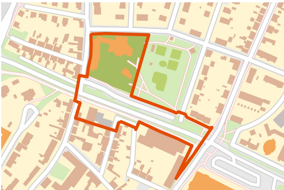
Planområdet med omgivningar

Planhandlingarna består av planbeskrivning, plankarta, illustration och planprogram.