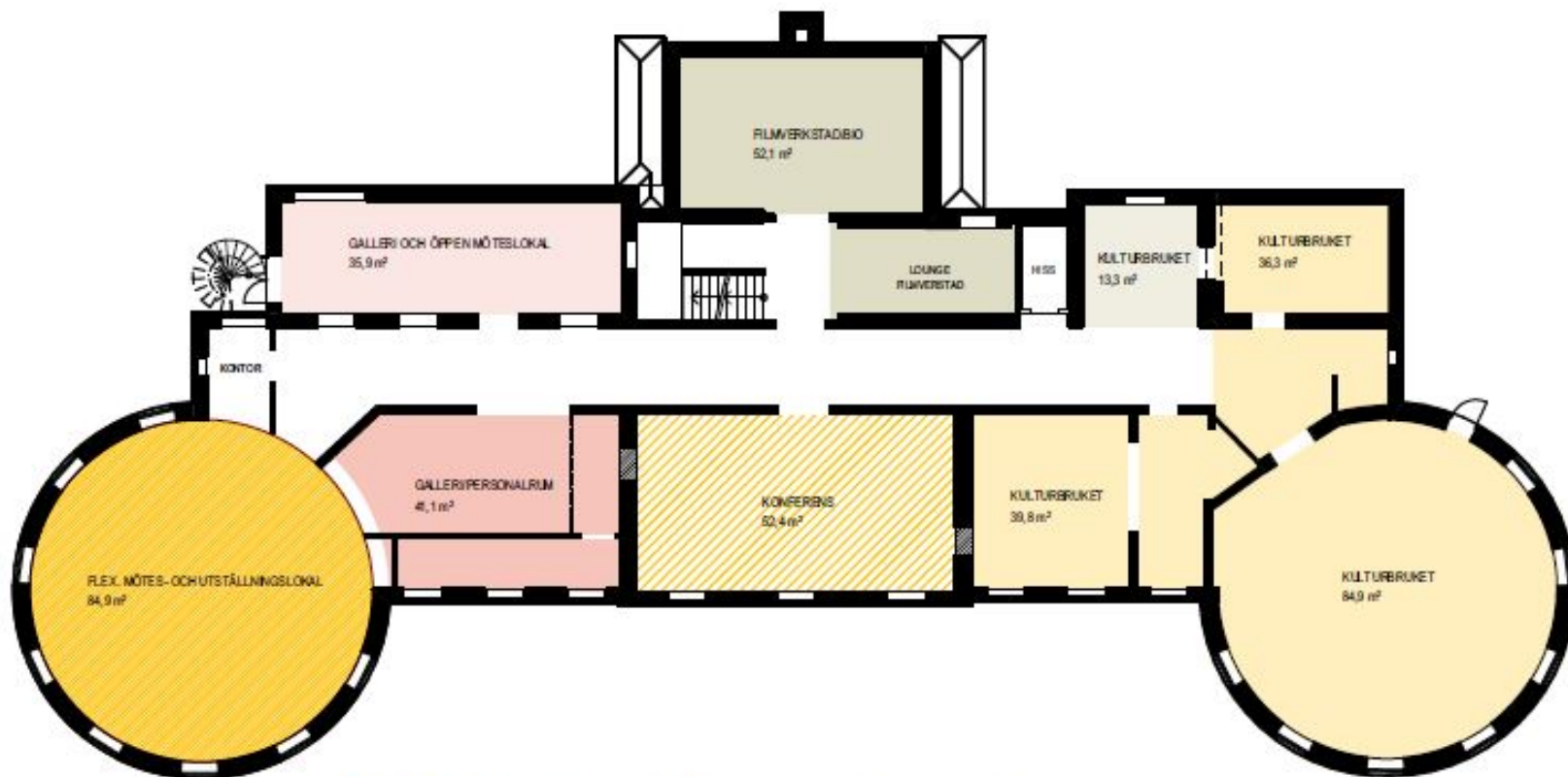
PLAN 2: Föreningsverksamhet