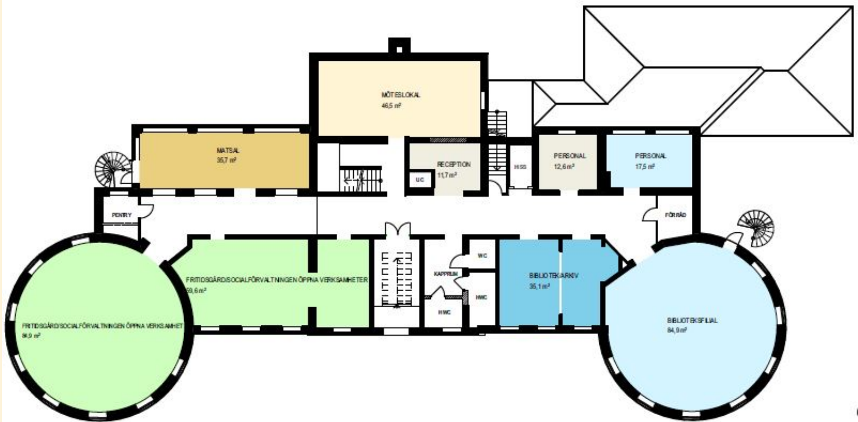
ENTRÉPLAN: Publik verksamhet