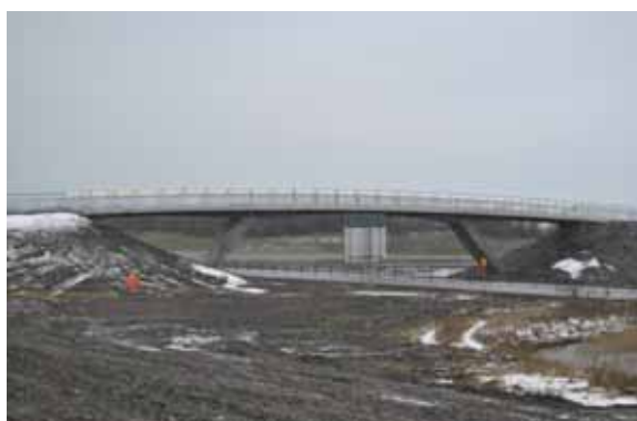
Gång – cykelbro över E6

Cykelväg kommer att byggas under 2016, eventuellt 2017, mellan Alstad och busshållplatser vid rondellen väg 101/108.