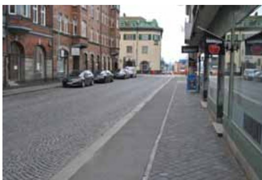
Gång och cykelväg, Östergatan

Under de senaste fem åren har totalt 360 inrapporterade olyckor inträffat i Trelleborg där cyklister varit inblandade. De allra flesta olyckor är måttliga eller lindriga men även två dödsolyckor och åtta allvarliga olyckor har inträffat under dessa fem år. Sammanställningen är ett utdrag ur databasen Strada, som är ett informationssystem för data om skador och olyckor inom hela vägtransportssystemet i Sverige. Strada bygger på uppgifter från både Polis och sjukvård.