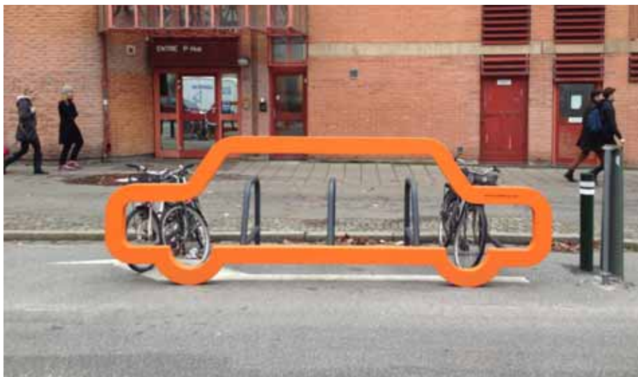
Cykelparkering från Malmö