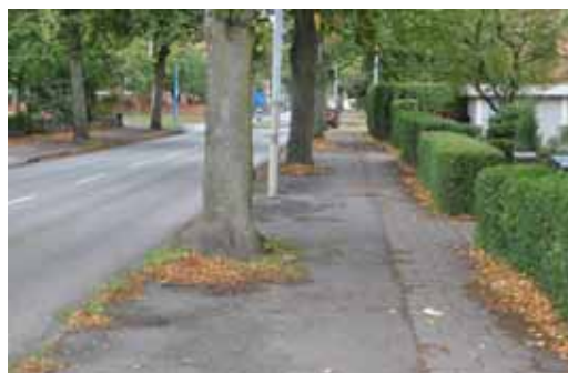
Gång- och cykelväg, Hedvägen

Cykelvägnätet består i hög utsträckning av dubbelriktade cykelbanor som delas med gångtrafiken, vilket i praktiken ger ett litet cykelutrymme. Cykelbanorna saknar vägmarkering men har till viss del annan markbeläggning än gångbanan. Det går att ta sig fram på cykel utan att dela väg med motorfordon men på många sträck bekvämt.