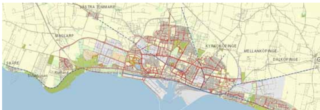
Prioriterade cykelstråk (blå) i Fördjupad översiktsplan för Trelleborgs stad