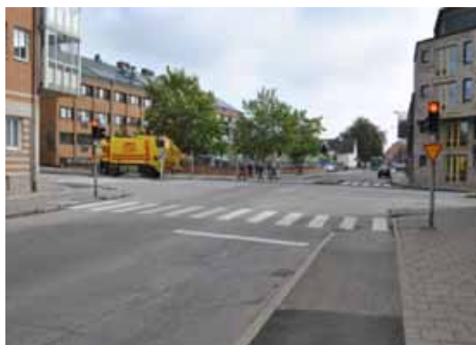
Fyrvägskorsning, Västergatan-Bryggaregatan Cykel och – gångbana

Vinterväghållning av cykelvägar sker i två prioriteringssteg. Det större cykelvägnätet ska vara framkomligt och halkbekämpat senast kl. 07.00.