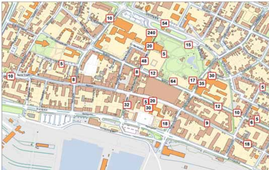
Karta 6 Cykelparkering i Trelleborgs centrum