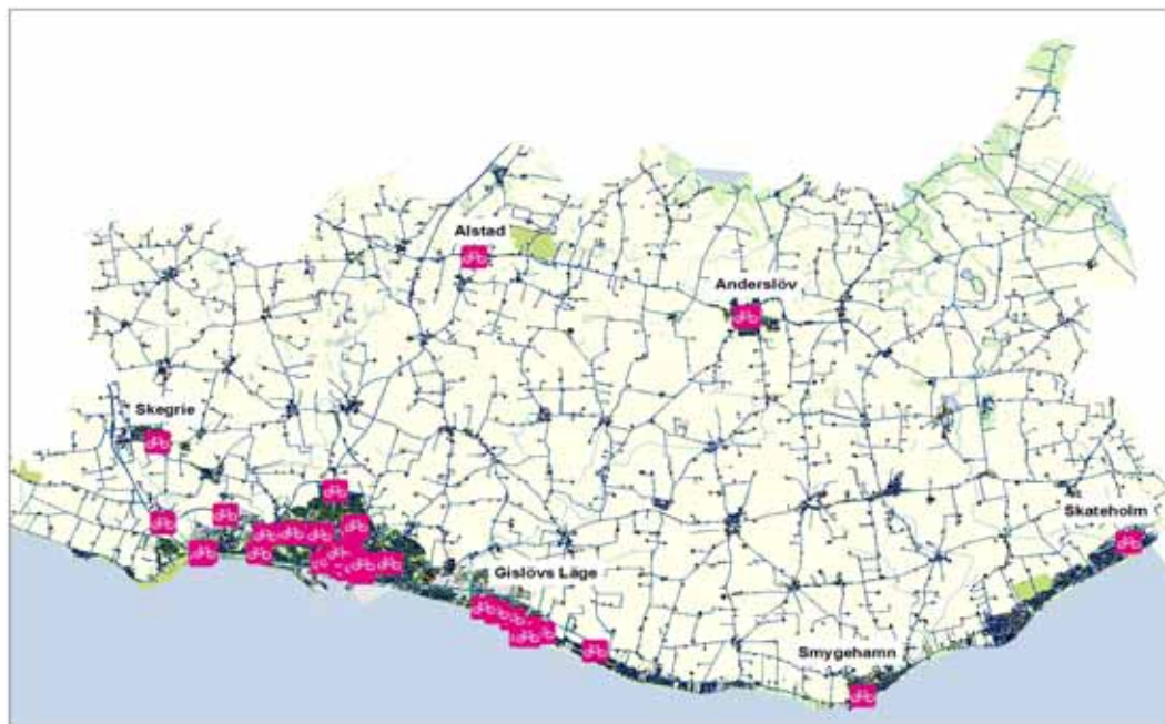
Karta 5 Cykelparkeringar i Trelleborgs kommun