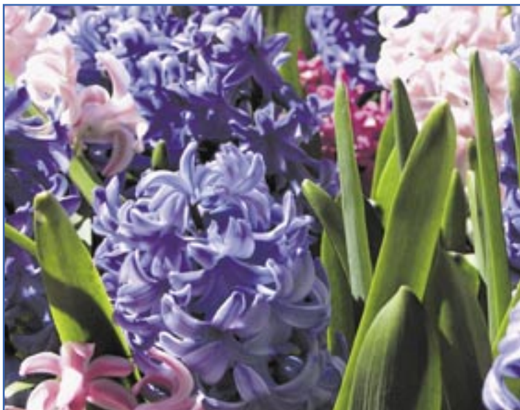
Hyacinternas starka doft kan orsaka flera veckors bekymmer för astmatiker och allergiker.