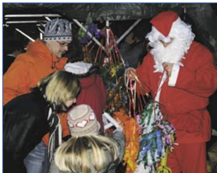
Första advent blir det traditionsenlig julmarknad på och kring Rådhusorget i samband med lykttändningscermonin.