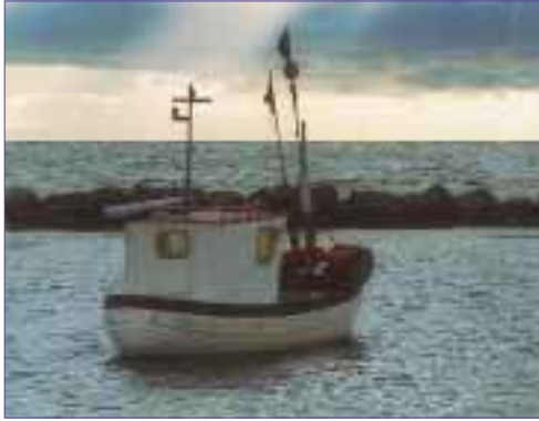
Fiskare i Trelleborg vill ha hårdare kontroll av de nuvarande torskfiskekvoterna.

Syrebristen är det första: Mänskliga aktiviteter på land (gödsling av jordbruksmark, bilkörning, vattenklosetter m m) bidrar till ökad näringstillförsel till havet vilket gynnar tillväxten av främst alger. När algerna bryts ner förbrukas stora mängder syre. Det blir inget syre kvar till