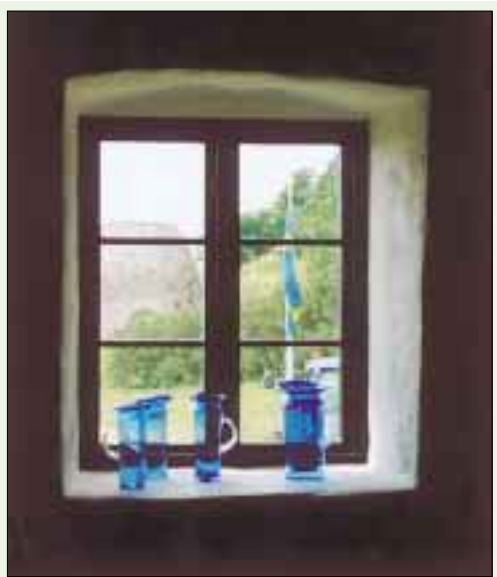
Högsommar. Magasinet i Smyge. Glasutställning.

Populäraste inköp var vykort med frimärke och Smyge-stämpel, unik för turistbyrån i Smygehamn.