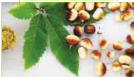
Ätlig, äkta kastanj. Bladen är spetsigare, kastanjerna mindre och kastanjeskalen taggigare jämfört med den oätliga hästkastanjen.

Han svarar gärna på dina frågor om allt som rör trädgård och växtlighet.