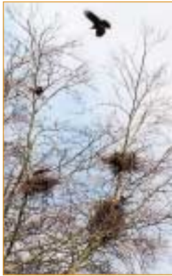
Råkor och råkböns

Råkorna drabbades under 1960-talet av kvicksilverförgiftning, men fåglarna repade sig och kom tillbaka.