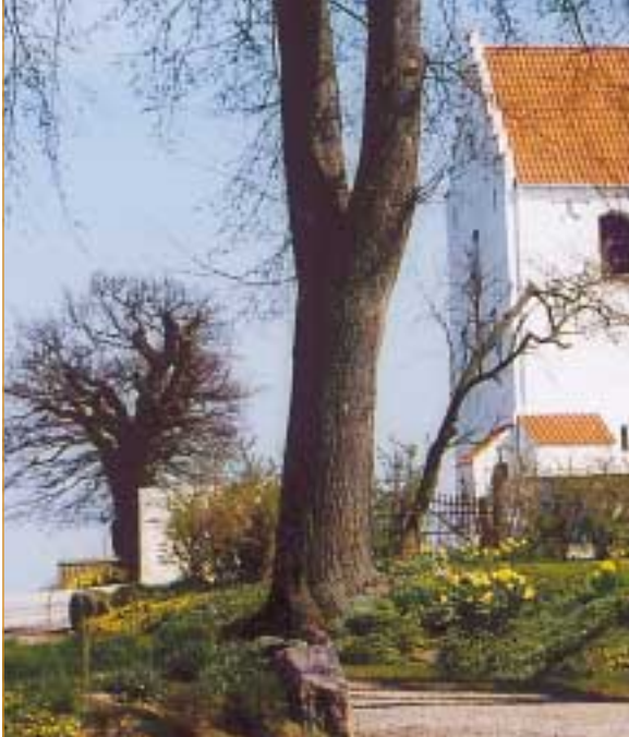
Den gamla eken framför kyrkporten i Bodarp är toppad och har varit dubbelt så stor.

Storken var förr en karaktärsfågel på Söderslätt. Sista häckningen i Skåne var 1954 i Karups Nygård, där man nu försöker återinföra lyckobringaren.