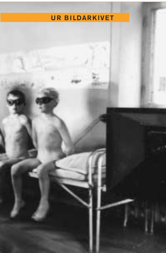
Hos Syster Sol på Konkordia.