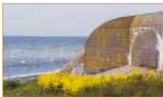
Fort från Per-Albinlinjen finns längs hela kusten.

värnen vid k u s t e n - uppfördes i all hast 1939-1940 då en tysk i n v a s i o n befarades. De bildar