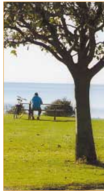
85 miljoner människor påverkar vattenmiljön i Östersjön.

Östersjön är ett ungt hav och har varit insjö två gånger på 15 000 år. Det är världens största ”havsvik”, med en blandning av sött och salt vatten. Havet omges av nio länder och får vatten från landområden fyra gånger större än havet självt. Det tar 30–50 år för allt vatten att bli utbytt. Havets miljö utsätts för ständig stress.