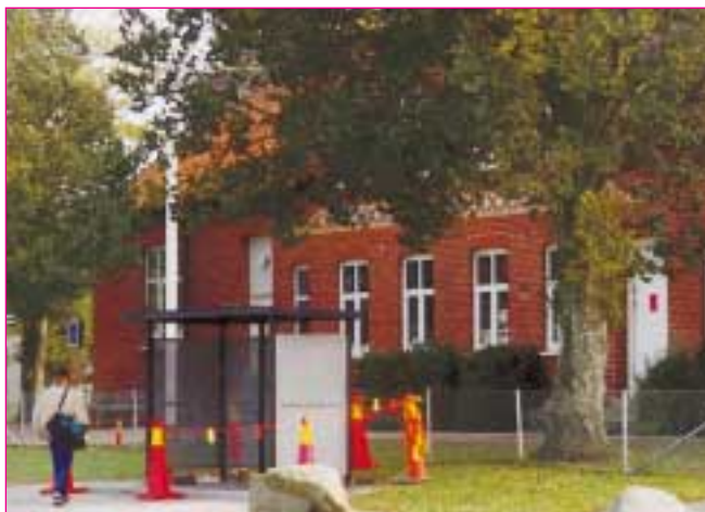
Modeshögsskolan är en av de skolor där eleverna ska få vara med och rita om skolan.

Ett familjecentrum ska knytas till varje rektorsområde. Socialarbetare och skolpersonal ges då nödvändiga förutsättningar att tillsammans jobba med familjens behov. Här ska finnas öppen förskola, socialvård, mödravård och medborgarkontor. Familjecentrat blir den naturliga samlingsplatsen, också på fritid och helger.