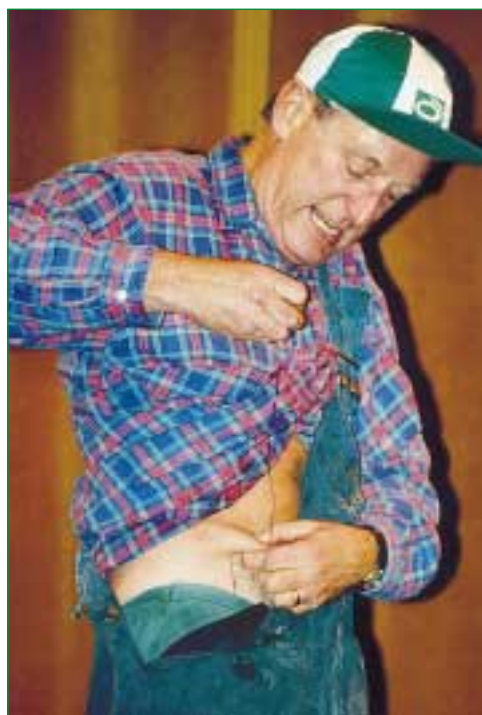
Bra karl klarar sig själv. Ur nyårsrevyn i Kristianstad 1998: "Blunda och ge".