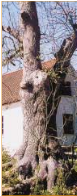
Här, under askens rötter, hade gudarna sina boningar.

X är beteckningen för något okänt. Framtiden är okänd trots planering och visioner. Det enda som är säkert är att landskapet kommer att se annorlunda ut än i dag.