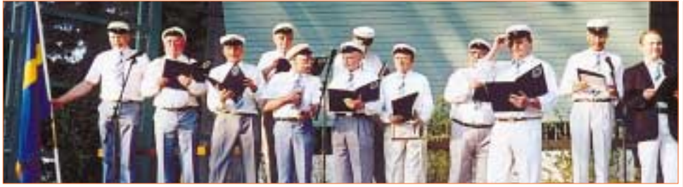
Nationaldagen. Manskören sjunger i Stadsparken