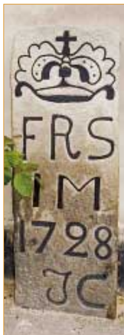
Milstenen utanför Anderslövs gästis

Väg 101, Landsvägen, är en gräns mellan slätten och backlandet.