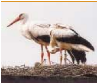
Storkar kan man numera se i hägnet på Karups Nygård

S torken övergav slätten för många år sedan. En av de sista boplatserna fanns på Alstadgården.