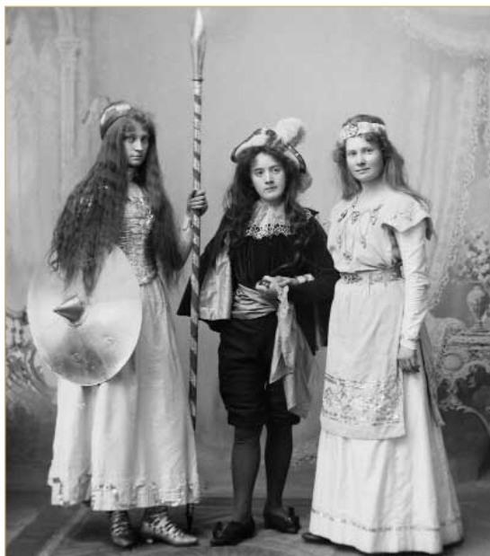
Tioöresföreningens basar 1923

YLWA MORITZ, fotograf på Trelleborgs museum TELEFON 0410-530 46 ylwa.moritz@trelleborg.se