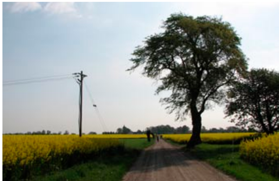
Grönt stråk i odlingslandskapet

Stommen i Trelleborgs kommuns grönstruktur utgörs av så kallade gröna korridorer i landskapet. Gröna korridorer är långa sammanhängande stråk i landskapet vilka mer eller mindre består av natur och grönska. Dessa korridorer bryts bara undantagsvis av barriärer vilka oftast består av asfalterade vägsystem eller industriområden. Gröna korridorer binder samman stadens och byarnas gröna ytor med varandra och med det omgivande landskapets värdefulla gröna natur- och kulturmiljöer. Gröna korridorer fungerar därigenom som viktiga förbindelser mellan stad och landsbygd. De gröna korridorerna kan vara betydande spridningsvägar för fauna och