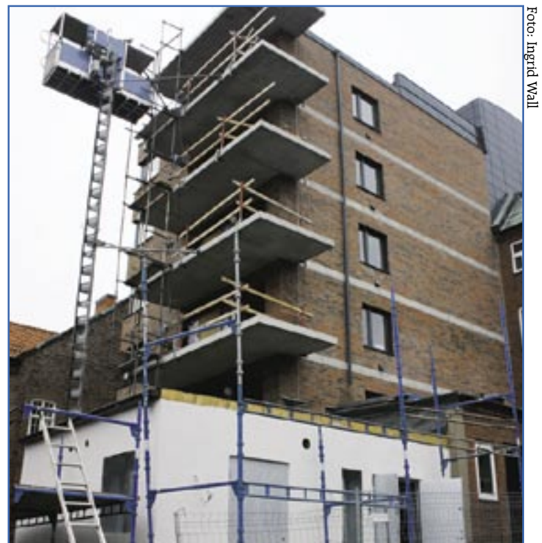
Sex våningar högt reser sig huset vid Rådhusorget.

Fotnot: Trelleborgshem är helägt av Trelleborgs kommun. Bolaget äger drygt 2 000 lägenheter, främst i Trelleborg och Anderslöv.