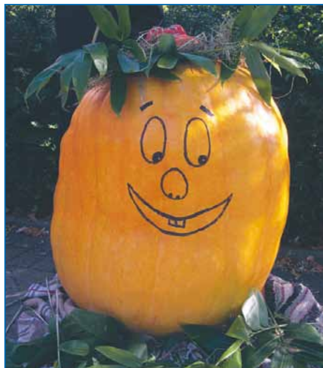
Vackra, fula, roliga, små och stora pumpor tävlar på Skördefesten.